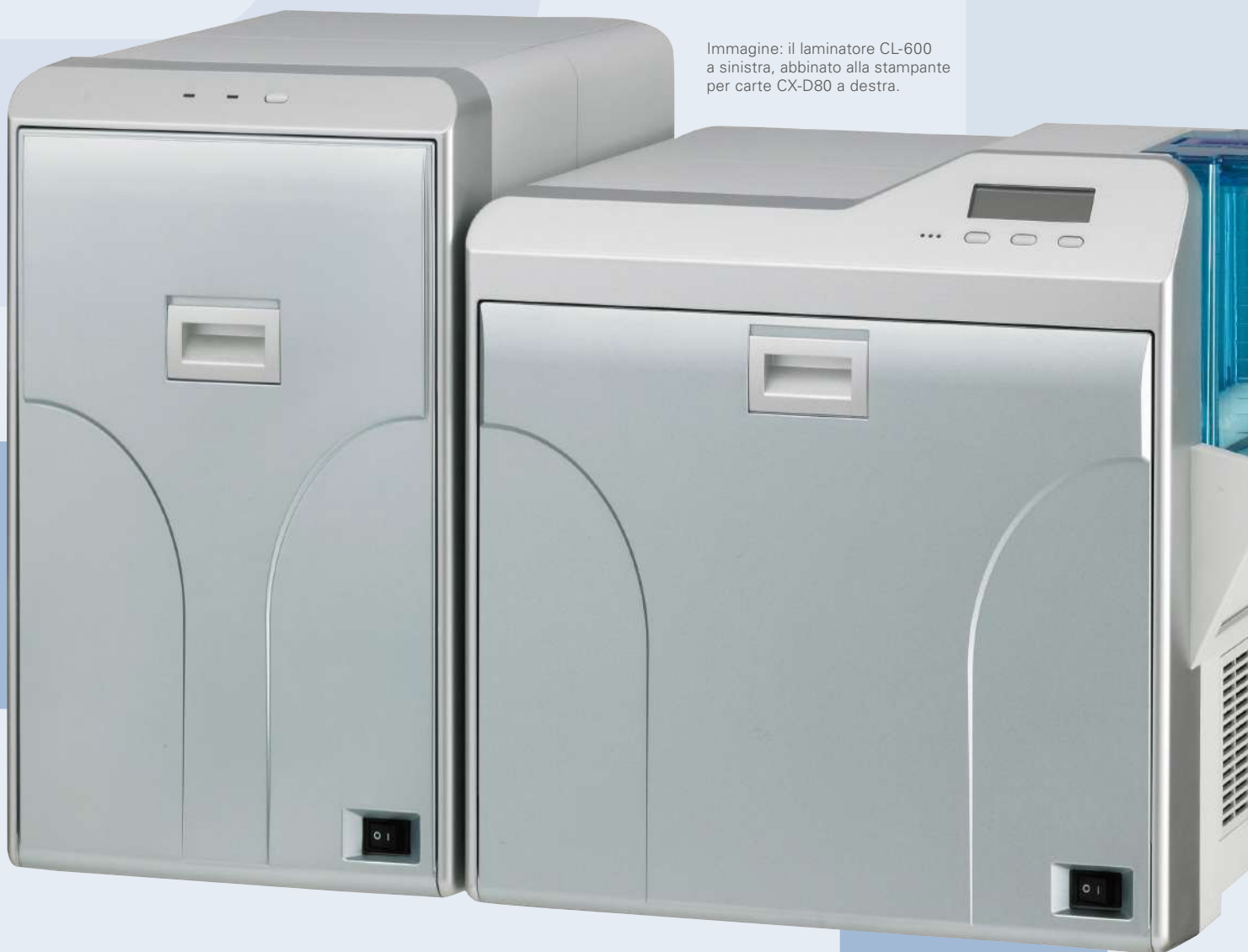
Immagine: il laminatore CL-600 a sinistra, abbinato alla stampante per carte CX-D80 a destra.

Adottando la comunicazione a infrarossi con la CX-D, non è necessario alcun cavo. Tramite il monitor di stato CX-D, tutte le impostazioni sono consolidate.